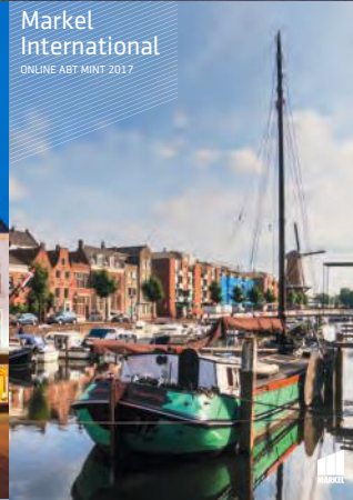
Markel International ONLINE ABT MINT 2017