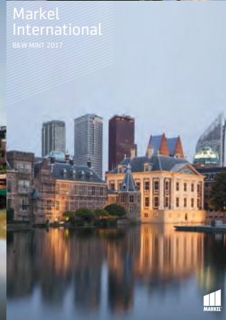
Markel International B&W MINT 2017