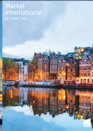
Markel International BA TP MINT 2017