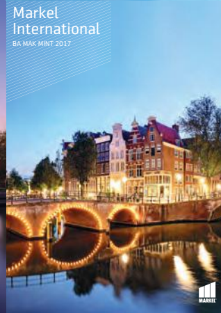
Markel International BA MAK MINT 2017