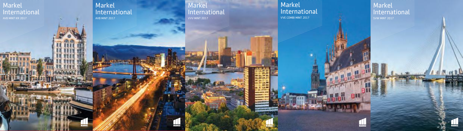
Markel International AVB MINT KR 2017