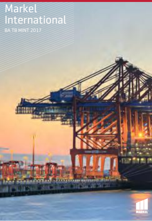
Markel International BA TB MINT 2017