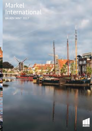
Markel International BA ADV MINT 2017