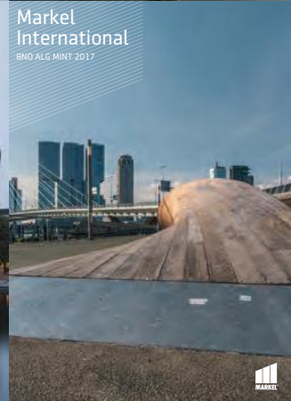
Markel International BNO ALG MINT 2017