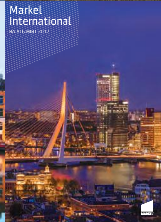
Markel International BA ALG MINT 2017