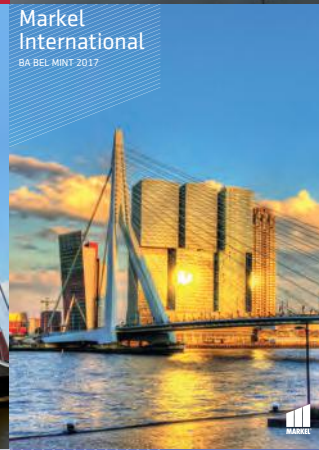
Markel International BA BEL MINT 2017