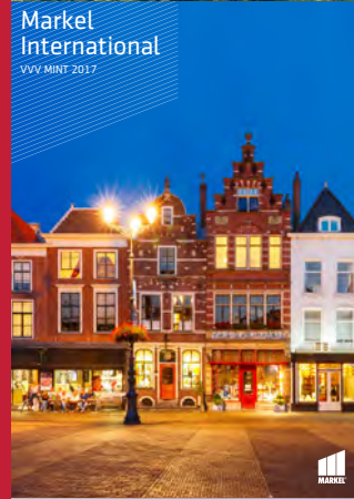
Markel International VVV MINT 2017