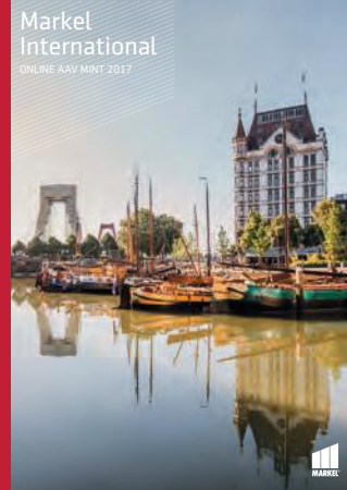
Markel International ONLINE AAV MINT 2017