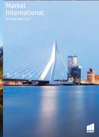
Markel International BA ADM MINT 2017